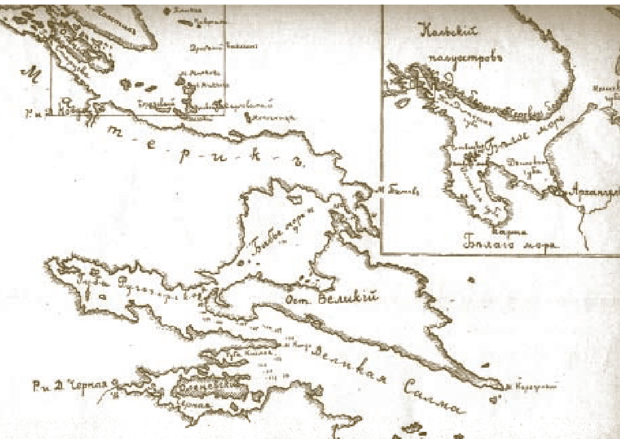
Карта Белого моря и залива Ковда. Из рукописей К. К. Сент-Илера

приспособленную для проживания большого числа студентов и для практических занятий. Очень хорошо, если бы в этом начинании приняли участие все русские университеты или, по крайней мере, северные. В виде отдаленной мечты мне представляется целая сеть таких станций, рассеянных по всей России, и устраивающее экскурсии общество. Я призываю всех лиц заинтересованных откликнуться на мой призыв и начать хлопотать по исходатайствованию необходимых средств и устройству станций».