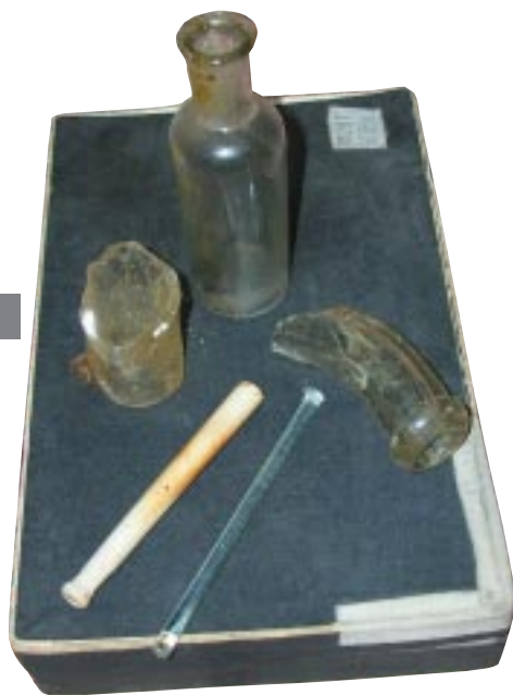
Остатки лабораторной посуды, найденные на одном из островов залива Ковда. Именно на этом месте находилась когда-то лаборатория К.К.Сент-Илера